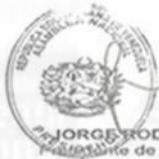
JORGE RODRÍGUEZ GÓMEZ Presidente de la Asamblea Nacional

Dado, firmado y sellado en el Palacio Federal Legislativo, sede de la Asamblea Nacional, en Caracas, a los veintitrés días del mes de diciembre de dos mil veinticuatro. Años 214° de la Independencia, 165° de la Federación y 25° de la Revolución Bolivariana.