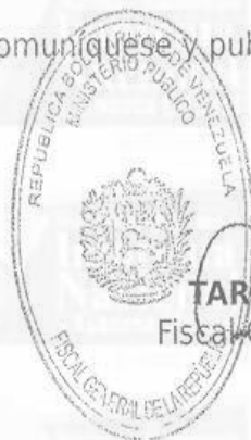
TAREK WILLIAMS SAAB Fiscal General de la República