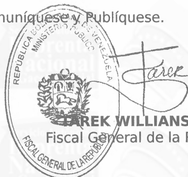
TAREK WILLIAMS SAAB Fiscal General de la República