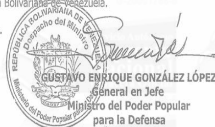
GUSTAVO ENRIQUE GONZÁLEZ LÓPEZ General en Jefe Ministro del Poder Popular para la Defensa